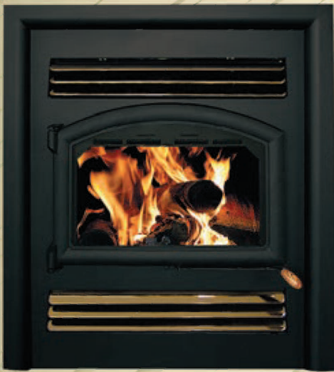
ÉVOLUTION 2113 CARRÉ/SQUARE