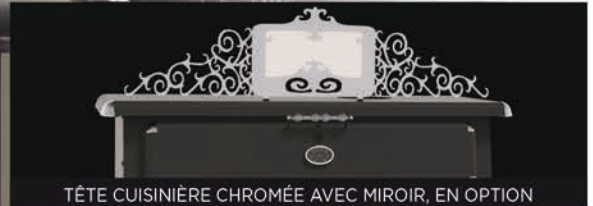
TÊTE CUISINIÈRE CHROMÉE AVEC MIROIR, EN OPTION